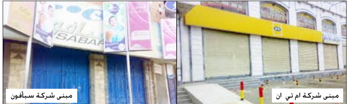
مبنى شركة سبافون